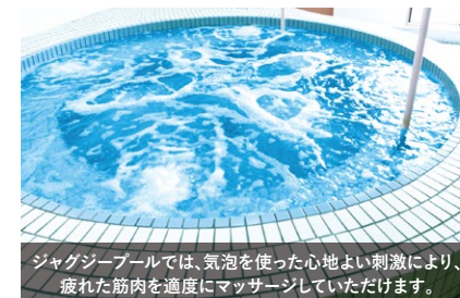
ジャグジープールでは、気泡を使った心地よい刺激により、疲れた筋肉を適度にマッサージしていただけます。