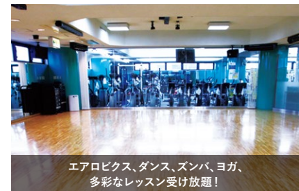
エアロビクス、ダンス、ズンバ、ヨガ、多彩なレッスン受け放題!