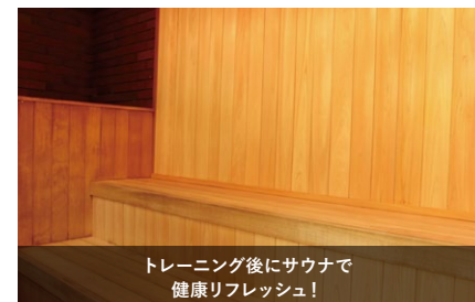
トレーニング後にサウナで健康リフレッシュ!