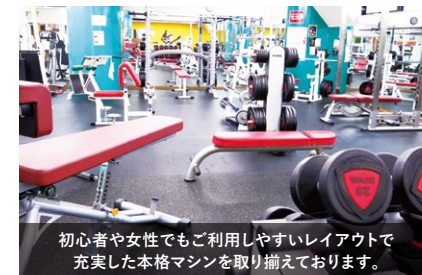
初心者や女性でもご利用しやすいレイアウトで充実した本格マシンを取り揃えております。

※完全予約制(ご利用の前日までにご予約ください)※ご体験後1週間以内のご入会で体験料キャッシュバック。※会員コースは60日終了後6ヶ月間会員在籍が必要です。