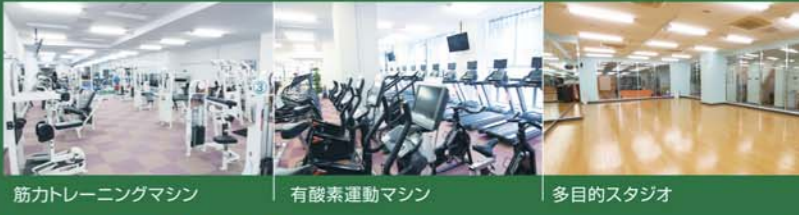
筋力トレーニングマシン 有酸素運動マシン 多目的スタジオ