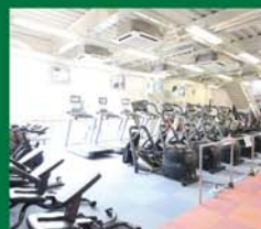
有酸素運動マシン(1F)

ご見学は、いつでもお気軽にお越し下さい。スタッフが案内します。(予約不要・無料) ※4/29(土)~5/5(金)はサブプール補修工事の為ご利用出来ません